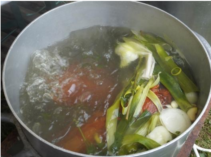
Les marcheurs pourront déguster l'échine fumée cuite dans un bon bouillon bien odorant.