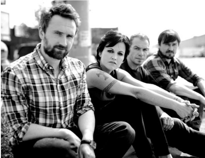
The Cranberries partagent l’affiche avec Amy MacDonald.

AU THÉÂTRE CE SOIR L'Irlande et l'Ecosse unies sur scène Le dossier confidentiel de... The Cranberries et Amy MacDonald