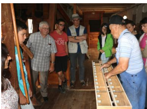
Le meunier montre un tamis fabriqué par les usines Martel Catala de Sélestat.

meunier, il présente même la famille du meunier et ses coutumes, s'émerveille Guy, venu de Barr en famille. C'est une visite à recommander, même pour les