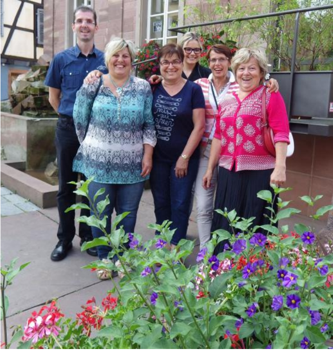
Les membres du jury.