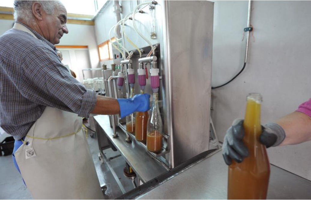
Les inscriptions pour presser ses pommes à Bietlenheim seront prises dès la mi-août.