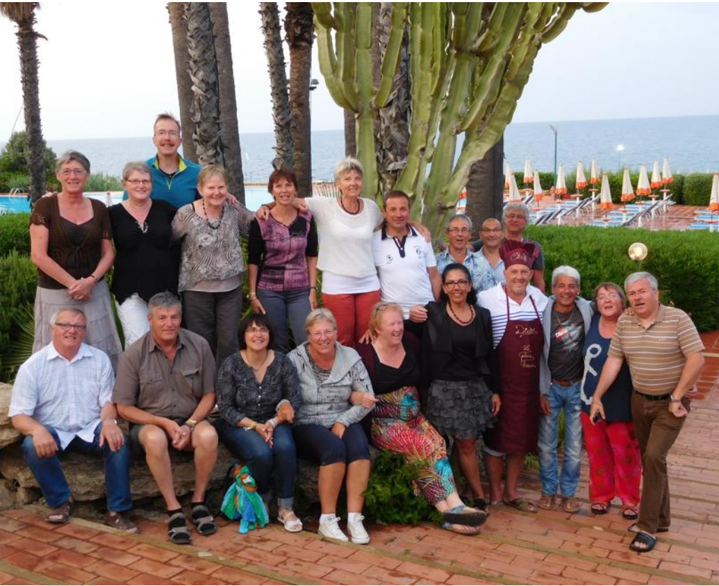
Les membres de la classe 61 sont partis en voyage en Sicile.

Les membres de la classe 1961 de Lièpvre, leurs amis et conjoints sont partis une semaine se réchauffer au soleil de la Sicile.