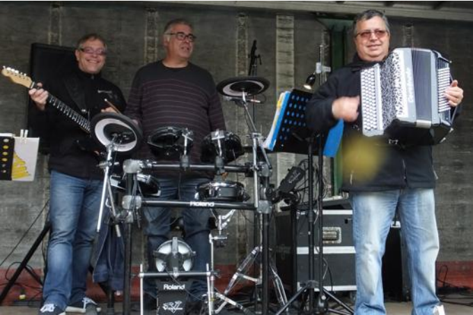
L'orchestre 'Free' Son animera comme en 2015 la fête montagnarde du côté des amis de la nature.

jambonneau, choucroute nouvelle, pomme de terre à l'eau, et vacherin. Tarif : 16 €. Pour accéder à la fête, plusieurs rues seront en circulation en sens unique. Il s'agit de la rue de la Gare, de la rue des Coccinelles, de la rue des Merles et de la rue Timbach. Le stationnement des véhicules se fera seulement d'un côté de la voie, l'autre étant réservé aux piétons.