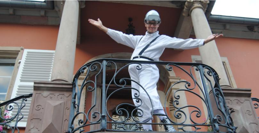
Le personnage du capitaine Sprütz a plus de vingt ans, mais il n'a rien perdu de son énergie !

vêtu a aussi parlé de sujets plus généraux comme le bonheur ou l'adolescence. Mais toujours avec un humour décapant. Le public, écroulé de rire, a semble-t-il apprécié