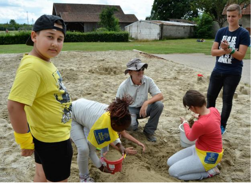
Les châteaux de sables, une des animations proposées.

► Renseignements auprès de la délégation de Châtenois/Sélestat, foyer Saint-Georges 4, rue de Gartfeld 67600 Sélestat, 0681952843.