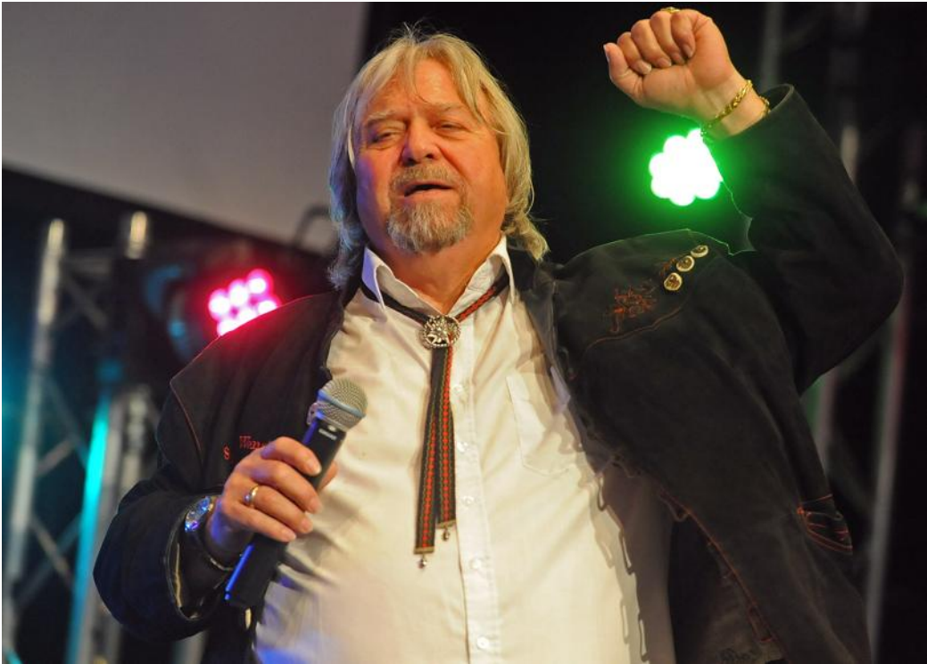
Anton aus Tirol ne s’est pas totalement lâché.

Lui n’a pas eu les honneurs du théâtre de plein air. Pourtant, Anton aus Tirol fait figure de référence dans son genre. Le public de la halle aux vins ne s’y est pas trompé et a réservé à son idole un accueil digne de son rang.